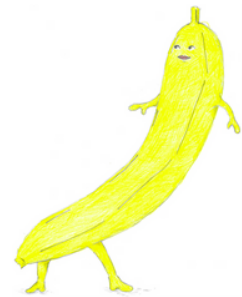
バナナオバケ ジェイ・アイ

また、私も上記のような状況なので、最近お逢いできていないメンバーの方々とも、まずはお互い気楽な気持ちで顔を合わせることができれば、と思っています。