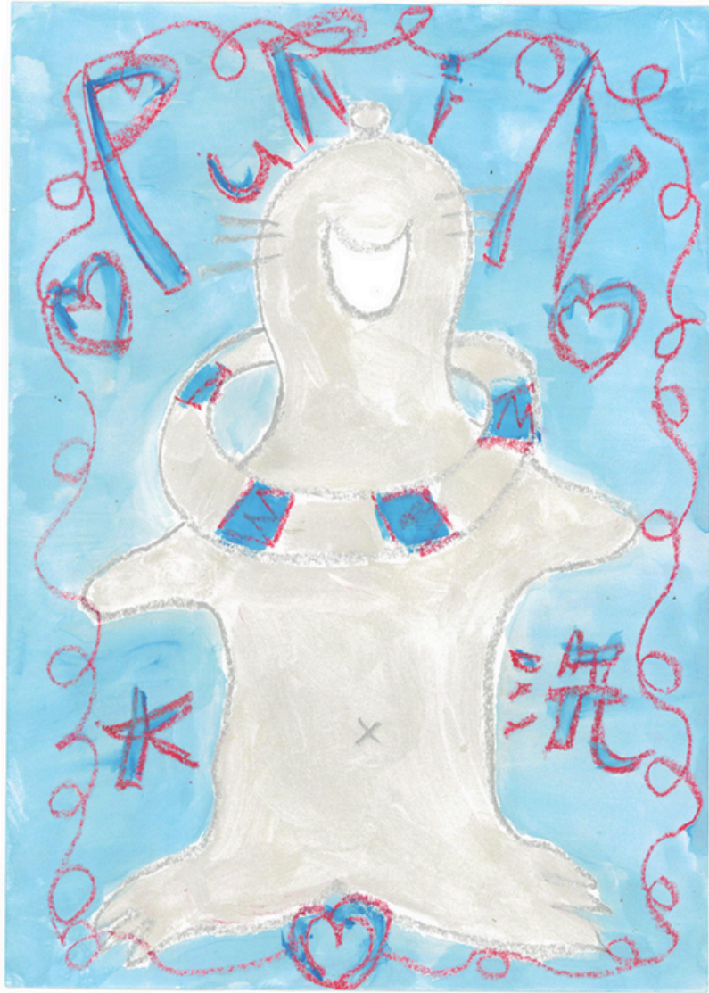
プリンちゃん 地陽水